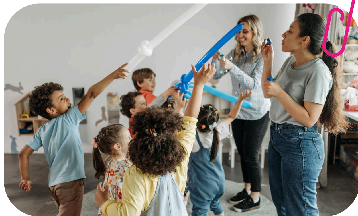
Animation auprès d'enfants